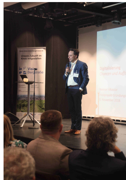
Keynote-Speaker Ammar Alkassar

Eine neue Herausforderung sei also, immer kürzere Innovationzyklen zu berücksichtigen. Das habe auch Auswirkungen auf die Anforderungen an den Arbeitsmarkt und seine Strukturen. Nur einen Beruf zu erlernen, werde in Zukunft nicht mehr ausreichen. Daher müssten Methoden entwickelt werden, die Menschen in diesen Innovationszyklen mitnehmen: lebenslanges Lernen wird ein Standard-Prozess werden, so Alkassars These.