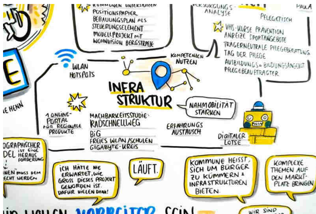
Ausschnitt aus dem begleitenden Graphic Recording, Franziska Rufflair