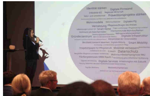
Präsentation der Maßnahmen

Im Anschluss an die Übergabe der Preise wurden die anstehenden und in Planung befindlichen Maßnahmen in den drei Handlungsfeldern Wohnen, Gesundheit und Infrastruktur / Digitalisierung vorgestellt.