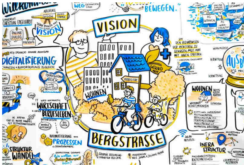
Ausschnitt aus dem begleitenden Graphic Recording, Franziska Rufflair

08. November 2018, 18:30 bis 21:00 Uhr, Restaurant Gossini, Heppenheim