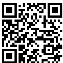
Bildungspaket im Kreis Bergstraße