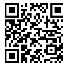
Bildungspaket im Kreis Bergstraße